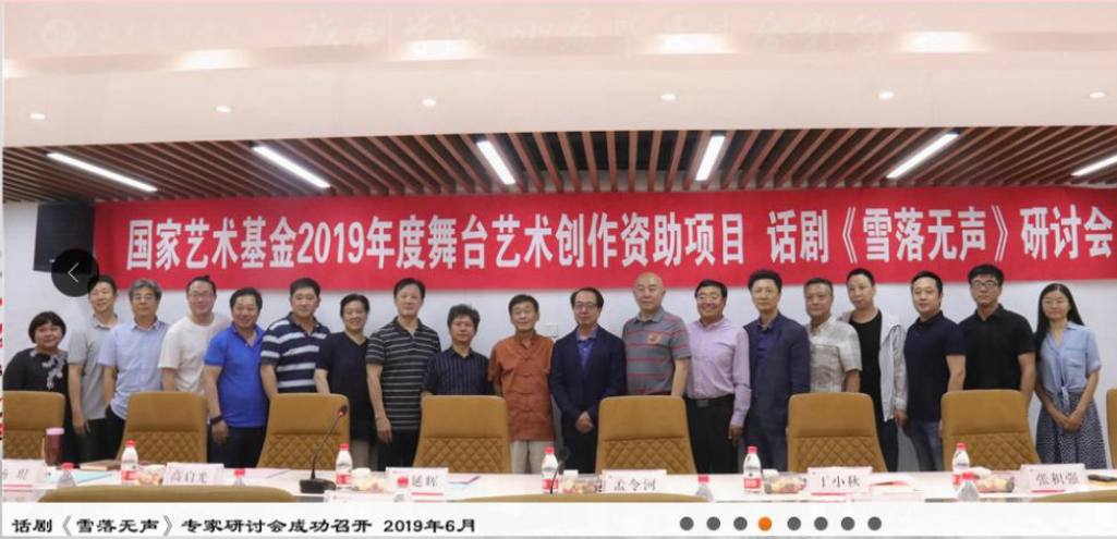
话剧《雪落无声》专家研讨会成功召开 2019年6月