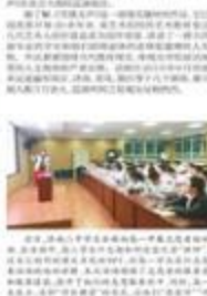
山东省教育厅颁发经典名著阅读展示活动金奖