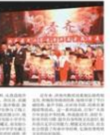
济南市代表队在全省中小学经典名著阅读展示活动中取得优异成绩

【本报济南12月26日讯】山东省教育厅近日举办了全省中小学经典名著阅读展示活动。济南市代表队在此次活动中表现优异，三个组别均荣获了金奖，充分体现了济南学子对经典名著的深入理解和热爱。