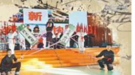
济南旅游学校用传统文化培育明礼学子 师生向善 校园润德

国家非遗、古建筑传承人... 济南旅游学校用传统文化培育明礼学子 师生向善 校园润德